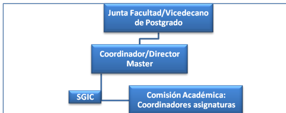
Figura 2.1. Esquema de la coordinación del Master en Virología

El Vicerrectorado de Postgrado y el Vicerrectorado de Estudiantes son los responsables de la gestión, plazos, admisión definitiva y matriculación de los alumnos de Master.